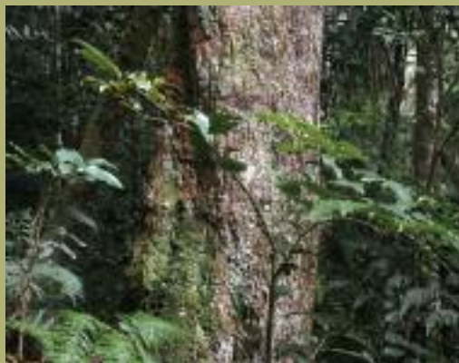
AMBORELLA TRICHOPODA, EN PRIMER PLANO, ES LA ANGIOSPERMA EXISTENTE MÁS ANCESTRAL, SEGÚN LAS RECONSTRUCCIONES FILOGENÉTICAS.