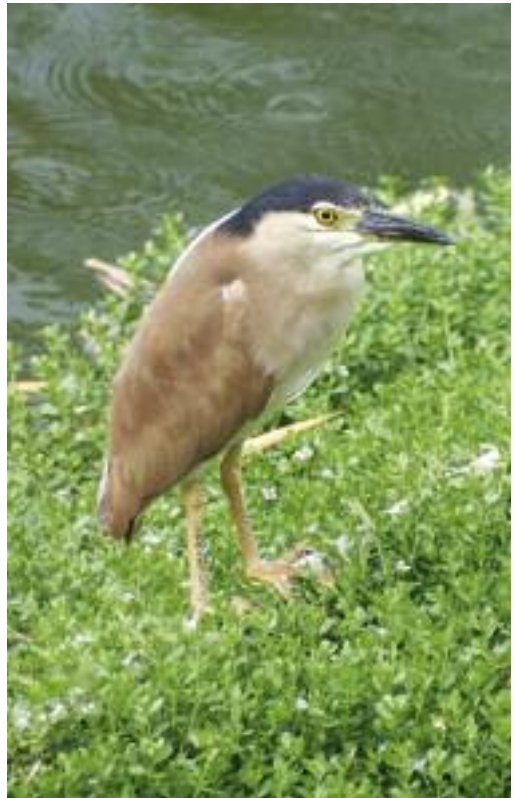
A LA DERECHA, NYCTICORAX CALEDONICUS EN EL ZOOLOGICO DE NOUMÉA.

salinidad ( Avicennia , Lumnitzera ). Mi contacto con el manglar fue muy escaso y sólo pude visitar los fragmentos que quedan en algunos rincones de la costa de Nouméa.