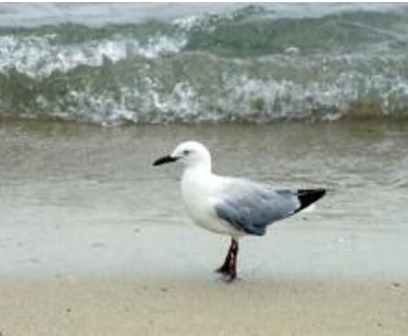
ARRIBA, UN EJEMPLAR DE GAVIOTA PLATEADA, LARUS NOVAEHOLLANDIAE , ES LA ÚNICA GAVIOTA COMÚN EN NUEVA CALEDONIA.