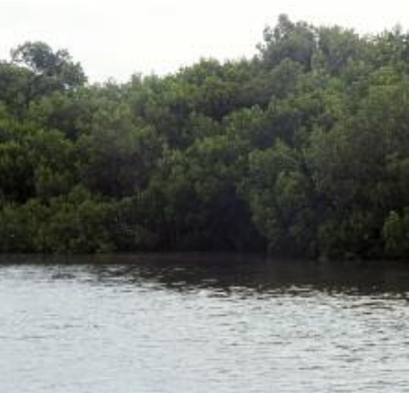
OTRAS FORMACIONES VEGETALES TÍPICAS EN NUEVA CALEDONIA SON EL MANGLAR (ARRIBA, EN LOS ALREDEDORES DE LA CIUDAD DE NOUMÉA) O LA PLUVIELVA (DERECHA, EN EL MONT KOGHI).