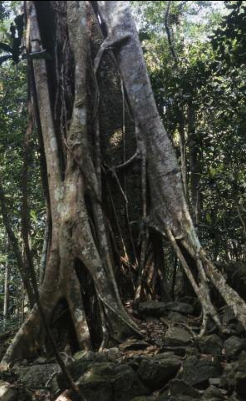
UNA HIGUERA ESTRANGULADORA EN MONT KOGHI.