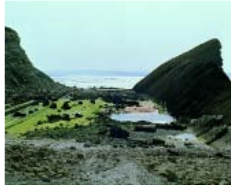
ENSENADA DEL MADERO EN LIENCRES LABRADA SOBRE MARGAS Y CALIZAS MARGOSAS TURONIENSES. LA CRESTA DE LA DERECHA ES CALIZA CENOMANIENSE BUZANDO 35° AL SUR.

Dentro del variado y valioso Patrimonio Geológico de Cantabria es de destacar que la zona costera comprendida entre la bahía de Santander y la desembocadura del río Pas, en-