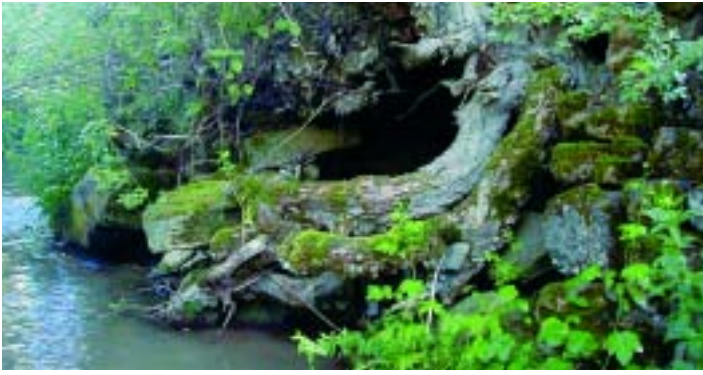
LAS MADRIGUERAS DE NUTRIA SUELEN SITUARSE EN LUGARES BIEN PROTEGIDOS Y RELATIVAMENTE INACCESIBLES. RÍO POLLA, CUENCA DEL EBRO.