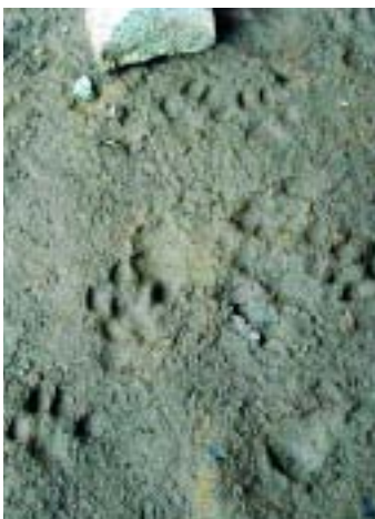
IZDA. HUELLAS DE NUTRIA. RÍO DEVA. ABAJO: LA NUTRIA SUELE DEPOSITAR SUS EXCREMENTOS EN LUGARES VISIBLES, LO QUE FACILITA SU DETECCIÓN.