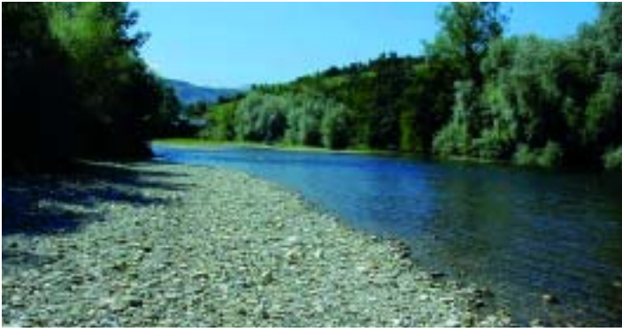
LAS NUTRIAS TAMBIÉN OCUPAN LOS TRAMOS BAJOS Y DE DESEMBOCADURA DE LOS RÍOS MEJOR CONSERVADOS. RÍO DEVA.

estaciones positivas es la del Escudo con un 100% (4 de 4), seguida de las del Nansa con el 91,7% (11 de 12) y de la del Deva con un 81,8% (18 de 22). Si nos referimos a cuadrículas UTM de 10x10 km, se ha detectado la presencia de la especie en el 70,6% de cuadrículas muestreadas (FIGURA 1).