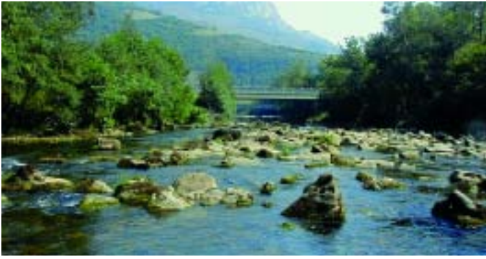
LA NUTRIA HA DESAPARECIDO DE LOS RÍOS DE LA ZONA ORIENTAL DE CANTABRIA, COMO EL RÍO ASÓN.

La evolución de la especie en Cantabria parece ser similar a la del resto de poblaciones europeas y españolas. Hasta la primera mitad del siglo XX la nutria se distribuía por todos los cursos fluviales de la región y su presencia podría calificarse como abundante. Sin embargo esta situación cambia radicalmente a partir de los años 60, en los que parece intensificarse la persecución por parte del hombre, que ha considerado tradicionalmente la especie como una "alimaña". Pese a todo, la nutria se mantuvo en las cuencas meridionales y occidentales de la región dónde fue detectada en los primeros estudios que se realizaron sobre la situación de la especie a nivel nacional (ELLIOT, 1983). Los resultados del censo nacional de 1984 apuntaban sólo a un 15,4% de estaciones positivas en Cantabria (PALOMERO Y AEDO, 1990) que, posteriormente, se vio incrementado a un 38,5% de estaciones positivas en 1996 (PALOMERO ET AL., 1998).